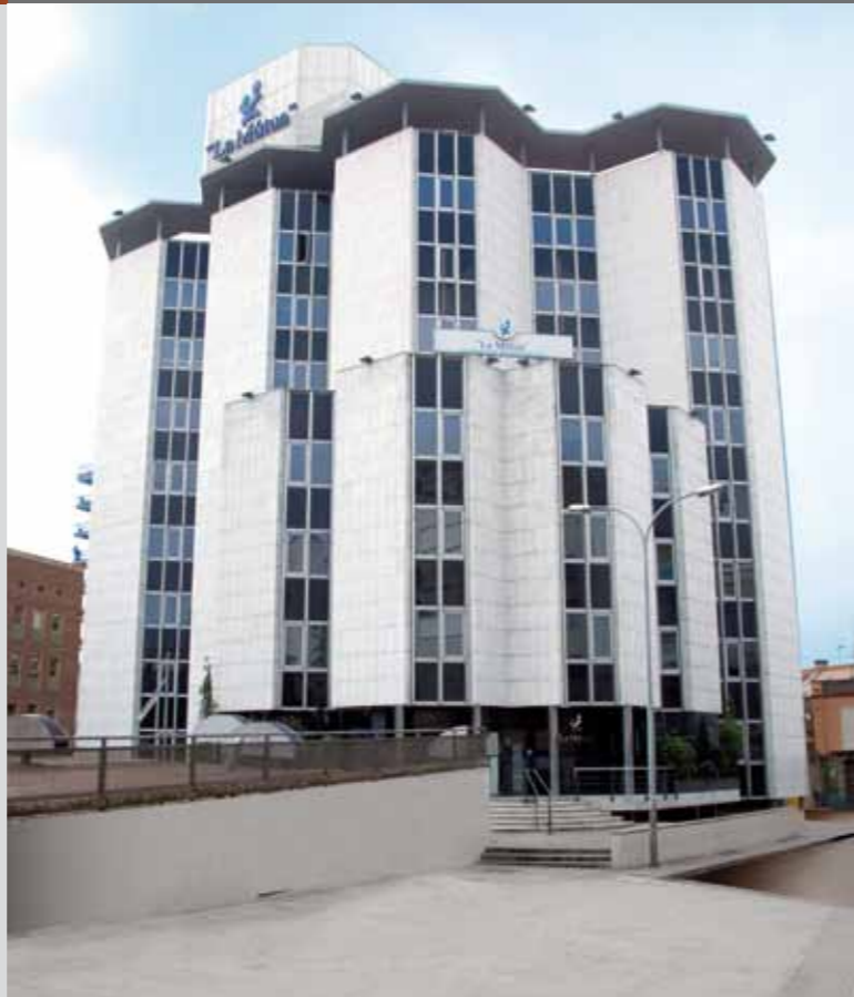
Edifici de 'La Mútua'

En properes edicions de la revista us anirem informant sobre les novetats de la Clínica.