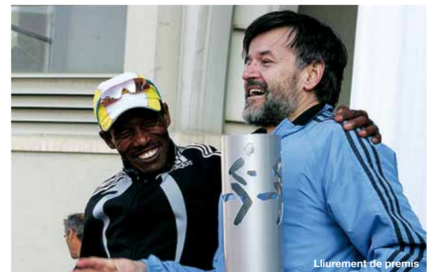
Liurement de premis