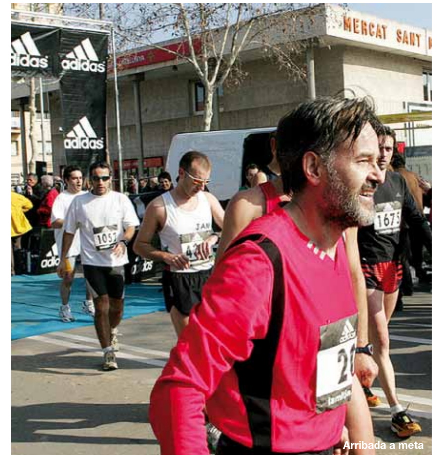
Arribada a meta

Una persona meravellada. Molta gent es pensa que a les dues del migdia, ja està! I no és cert, queda la post Mitja, s'han d'anar tancant molts capítols i al mateix temps anar gestant la propera edició. Si tot ha anat bé, penso: qui diu que estem a la societat de l'egoisme? Sempre em quedo meravellat de la quantitat de gent que es fa seva la Mitja i em reafirma que "Ú no és ningú", la Mitja és un projecte col·lectiu.